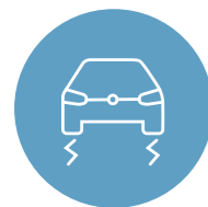
ELECTRONIC STABILITY CONTROL