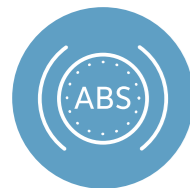
ANTI-LOCK BRAKING SYSTEM