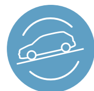
HILL DESCENT CONTROL

Hệ thống kiểm soát cự ly đỗ xe PDC. Sử dụng hệ thống camera lùi, các cảm biến, hệ thống màn hình và các vạch dẫn hướng, các âm thanh cảnh báo và hệ thống phanh hạn chế va chạm để hỗ trợ người lái ra, vào chỗ đỗ dễ dàng.